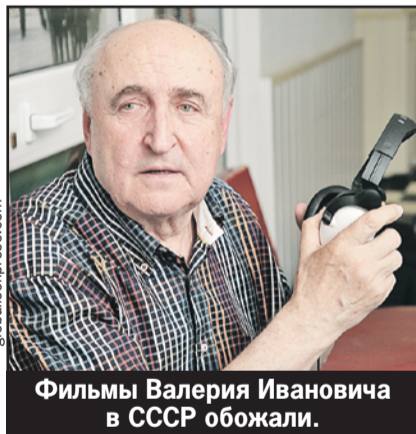
Фильмы Валерия Ивановича Ускова в СССР обожали.

Но, разумеется, главное ждало их впереди: масштабнейшие телесаги «Тени исчезают в полдень» и «Веч-