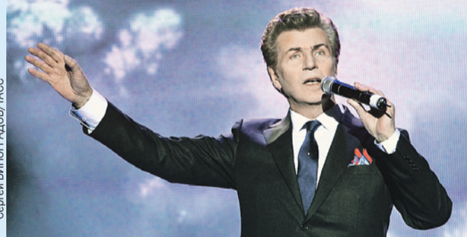
Песня «Фантазер» стала визитной карточкой артиста.

го пафоса. В одном из последних телеинтервью в программе «Привет, Андрей!» четыре года назад Евдокимов обрушился и на всю современную музыку, и на свой репертуар: «Вы «Фантазером» восхищаетесь, а там тоже ничего хорошего нет - музыка примитивная, да и певец никакой получился».