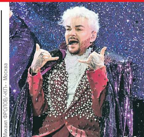
Михаил Фролов/«КП» - Москва