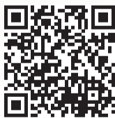
Фото присылайте в «Комсомольскую правду», e-mail: miss@kp.ru

Голосуйте за понравившуюся вам участницу на нашем сайте KP.RU в разделе «Будь стильной с «КП»!»