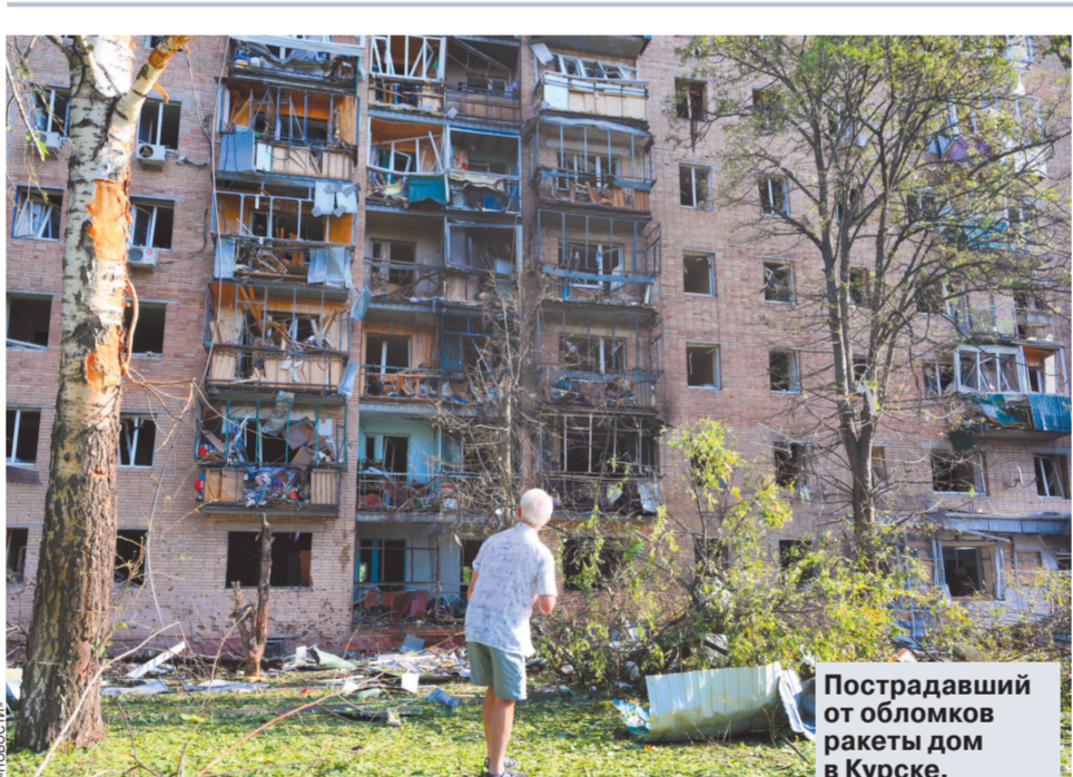
Пострадавший от обломков ракеты дом в Курске.