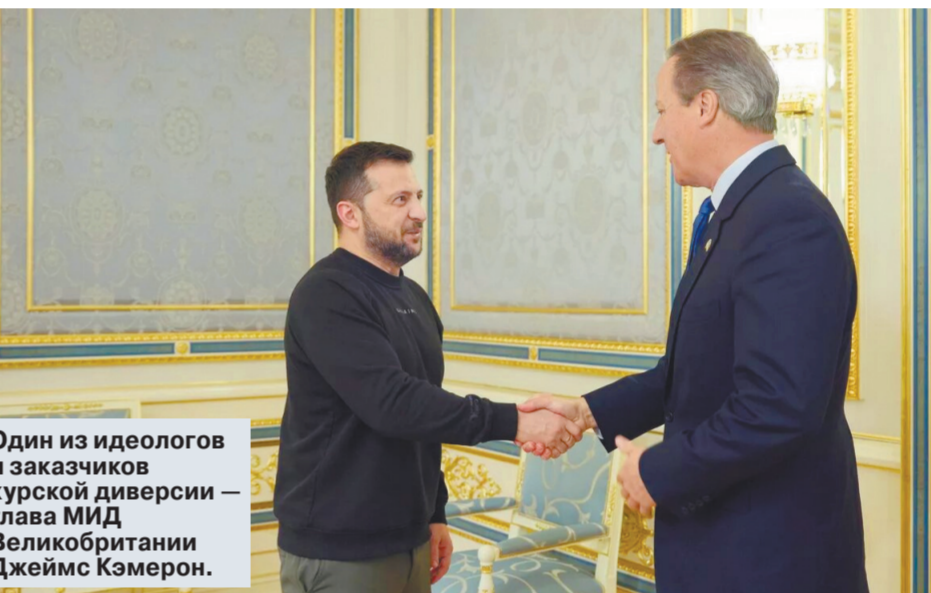
Один из идеологов и заказчиков курской диверсии — глава МИД Великобритании Джеймс Кэмерон.

Но время течет, эффект неожиданности истончается — принципиальная разница в соотношении сил вновь становится определяющей. Один из самых известных и уважаемых политических деятелей ДНР Александр Ходаковский написал в своем телеграм-канале: «На мой взгляд, противник совершил большую ошибку.