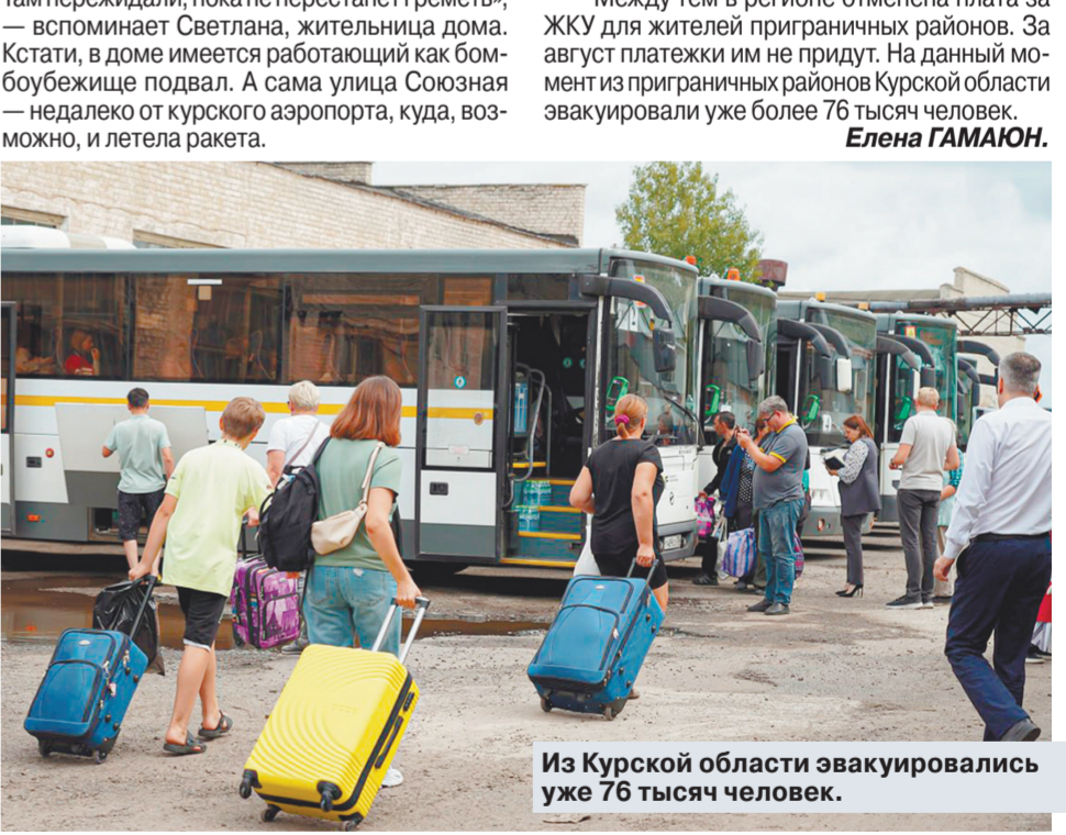
Из Курской области эвакуировались уже 76 тысяч человек.

занимались врачем, противник спокойно снял подразделения, они были перекинута сюда и подразделения подготовкой.