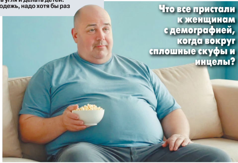
Что все пристали к женщинам с демографией, когда вокруг сплошные скуфы и инцелы?

«Вместо того чтобы искать причины своего одиночества в себе и пытаться изменить подход к понравившейся женщине, инцелы начинают ей презирать. Они проповедуют идеологию, основная мысль которой: мужчина имеет право на секс. Вплоть до того, что в своем кругу они даже делают словесные попытки оправдать физическое насилие. Слава богу, дальше разговоры эти идеи не идут».