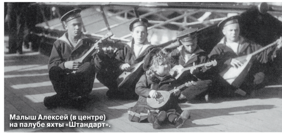
Малыш Алексей (в центре) на палубе яхты «Штандарт».