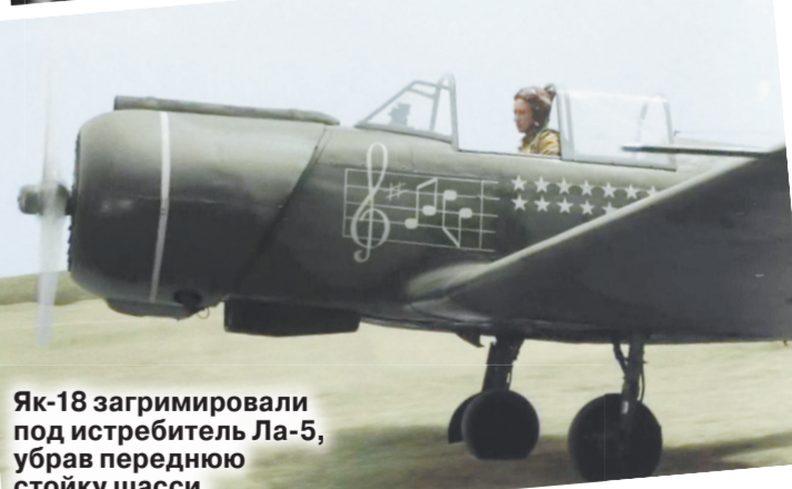
Як-18 загримировали под истребитель Ла-5, убрав переднюю стойку шасси.

киношное и идеологическое начало — не сразу решилось выпустить «В бой идут одни «старики» на экраны кинотеатров. Чиновники смущала «музыкальная составляющая» сценария фильма. Что это за несерьезный подход к военной теме: летчики-фронтовики поют! Разве такое могло быть в трагические и героические годы? Однако изменить свое решение обитателей важных кабинетов заставили заслуженные ветераны-авиаторы, которым на предварительных кинопоказах картина Леонида Быкова очень понравилась.