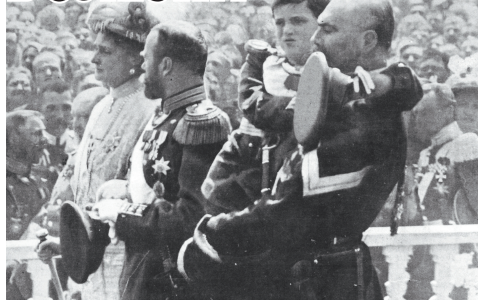
1913 г. Празднование 300-летия Дома Романовых. Во время этого парадного выхода царской семьи цесаревича несут на руках казак-конвоец.