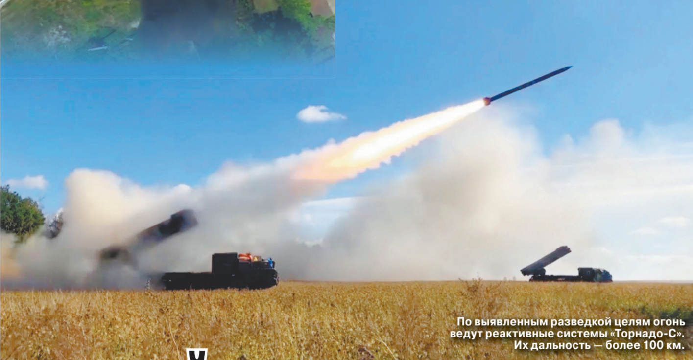
По выявленным разведкой целям огонь ведут реактивные системы «Торнадо-С». Их дальность — более 100 км.