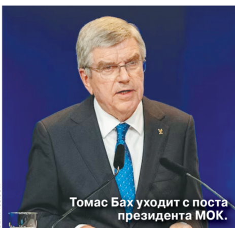
Томас Бах уходит с поста президента МОК.

«Постолимпийское похмелье залестнет весь политический класс Франции, с предстоящими бюджетными сокращениями, нелюбимыми парламентскими альянсами и недовольством избирателей», — считает Reuters. «Макрон попытается извлечь выгоду из ауры Олимпиады. Помешательство на Олимпиаде реально, но я не думаю, что это принесет ему какую-либо пользу», — выразила свою точку зрения сенатор Лор Даркос, добавив, что Игры не повысят популярность президента Пятой республики.