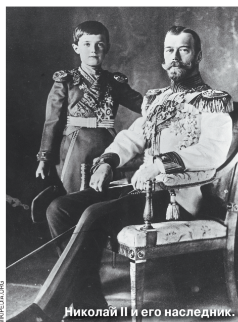
Николай II и его наследник.

Недаром этот недуг называли «викторианской болезнью». Считается, что первоисточником такого «поветрия», распространенного далеко от Пскова, где разорочивались все эти драматические события, — лежал в комнате царского дворца, стала английская королева Виктория, именно от нее пошел генетический