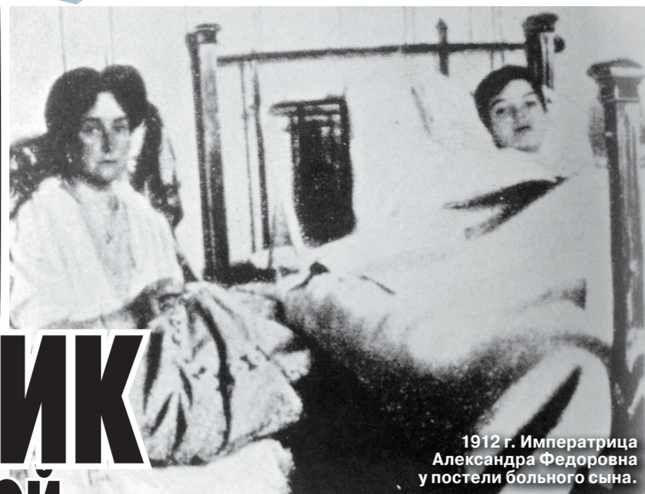
1912 г. Императрица Александра Федоровна у постели больного сына.

Исполнилось 120 лет со дня рождения Алексея Николаевича Романова — сына последнего царя Николая II, наследника престола, которому так и не суждено было занять русский трон. Он был расстрелян комиссарами за несколько дней до своего 14-летия, но остался в истории страны как один из самых противоречивых персонажей — баловень судьбы, обреченный на многие страдания, мальчишка, очень рано показавший свои взрослые мужские качества. Сегодня в «МК» — рассказ о некоторых обстоятельствах его жизни.