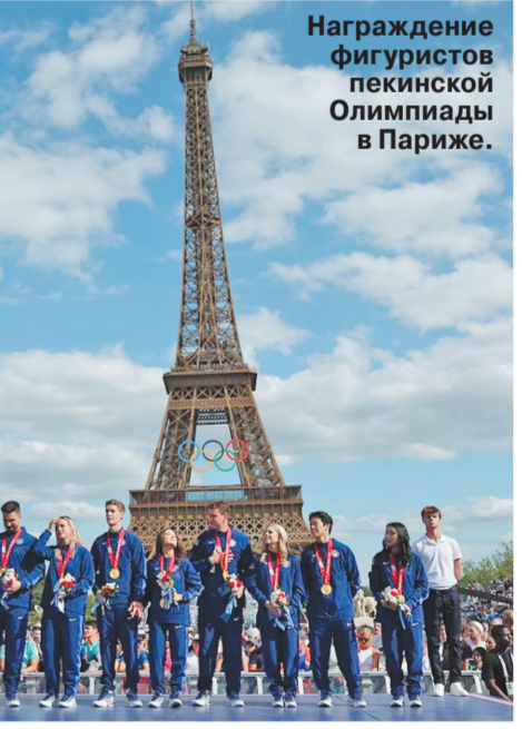
Награждение фигуристов пекинской Олимпиады в Париже.