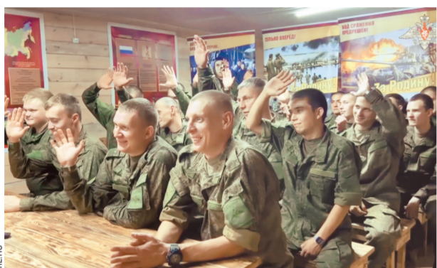
боевых задач в зоне СВО, о боевых буднях и взаимоотношениях в коллективе.

Необычный телемост был организован военным ведомством в зоне специальной военной операции (СВО). Его участниками стали артиллеристы группировки войск «Центр», выполняющие боевые задачи в зоне специальной военной операции, и военнослужащие в Челябинской области. Бойцы пообщались с молодыми военнослужащими, ответили на многочисленные вопросы, рассказали им о трудностях, с которыми столкнулись во время выполнения