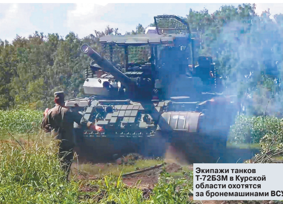
Экипажи танков Т-72Б3М в Курской области охотятся за бронемашинами ВСУ.

Этот эпизод, кстати, еще раз напомнил о необходимости соблюдения строгой «информационной гигиены» в зоне боевых действий.