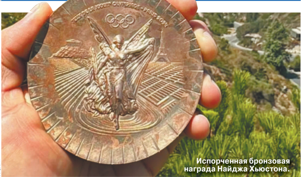
Испорченная бронзовая награда Найджа Хьюстона.