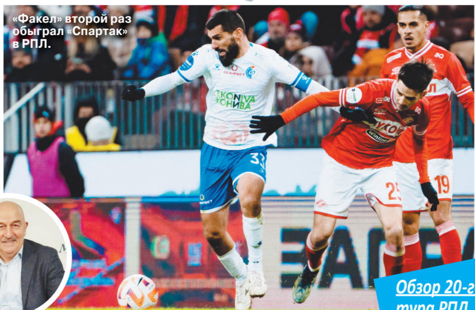
«Факел» второй раз обыграл «Спартак» в РПЛ.