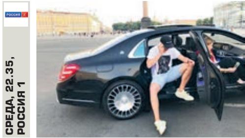
СРЕДА, 22.35, РОССИЯ 1