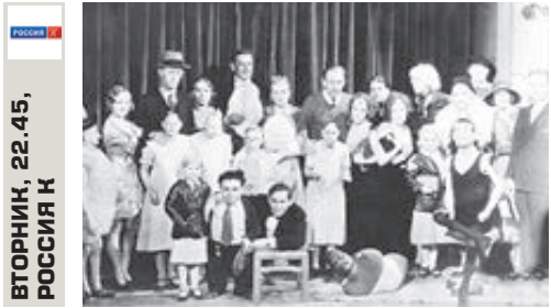
ВТОРНИК, 22.45, РОССИЯ К