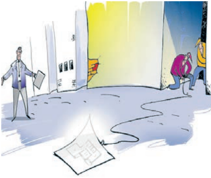
ИЛЛЮСТРАЦИЯ ВИТАЛИЯ ПОДВИЖНИКОВ / CARTOONBANK.RU

Как такое вообще возможно? Ведь доверенности на совершение всех сделок с недвижимостью за-