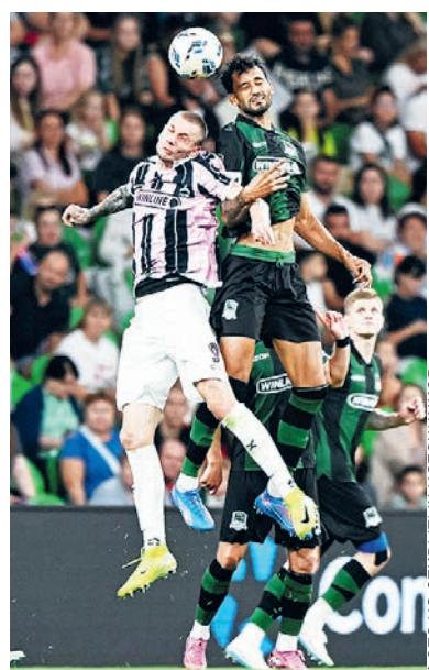
Команда «ФК 10», которая выступила против чемпиона России, принадлежит телеведущему Азамату Мусгалиеву.

«Труд» уже писал о победах другой команды Медиалиги – «Амкал» над профессиональными клубами второй лиги в матчах Кубка России. Но на прошлой неделе «Амкал» сам уступил команде «Союз чемпионов», в которой играют олимпийские герои Плющенко, Борзаковский, Немов, Легков и некоторые другие известные атлеты и которую тренирует бывший футболист сборной России Александр Мостовой. Откуда берутся непрофессиональные команды, показывающие столь высокий уровень?