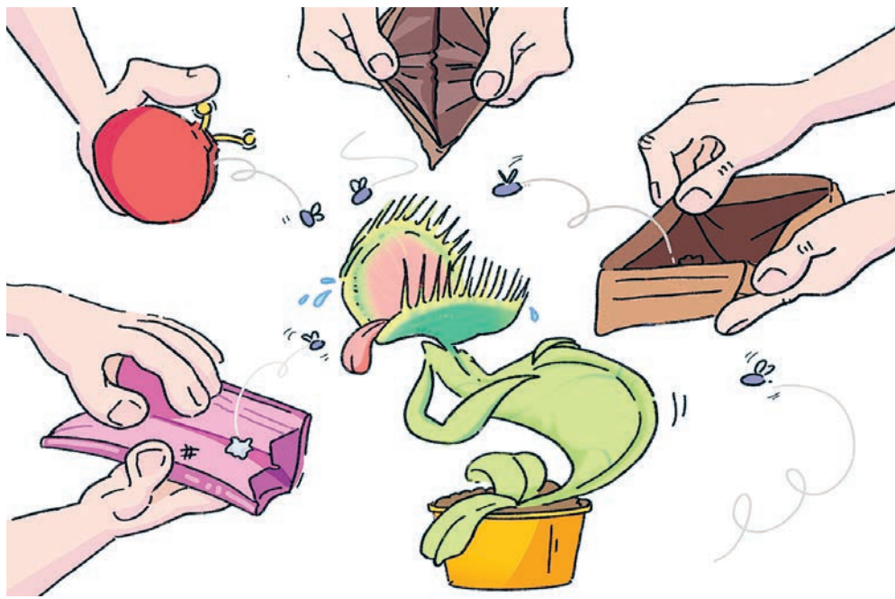
ИЛЛЮСТРАЦИЯ НАСТАСЬИ КОВАЛЕВСКОЙ

Тем временем эксперты Финансового университета при правительстве РФ сообщают: зарплатные ожидания россиян растут в полтора раза быстрее, чем реальные зарплаты. Согласно опросам, большинство населения считает нормальной среднюю зарплату в 146 тысяч рублей, а фактически она едва перевалила за 92 тысячи. Также выяснилось, что самые амбициозные мечтатели живут в Махачкале – они хотят в среднем 213 тысяч рублей. Затем идут Хабаровск (188 тысяч), Москва