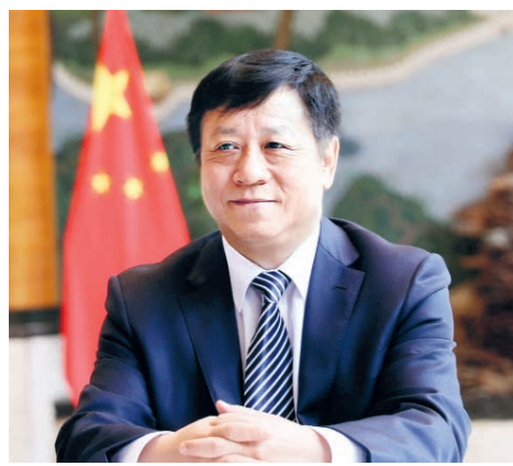
ЧЖАН ХАНХУЭЙ ЧРЕЗВЫЧАЙНЫЙ И ПОЛНОМОЧНЫЙ ПОСОЛ КИТАЙСКОЙ НАРОДНОЙ РЕСПУБЛИКИ В РОССИЙСКОЙ ФЕДЕРАЦИИ

Пекин золотой осенью встретил гостей ясной погодой. Площадь Тяньаньмэнь величественна и торжественна, парадные расчеты Народно-освободительной армии Китая демонстрировали безупречный воинский порядок и несгибаемую выправку. Отзвуки славы и истории трепетали в сердцах. С 31 августа по 3 сентября с. г. по приглашению председателя КНР Си Цзиньпина президент РФ В.В. Путин посетил Китай для участия в Тяньцзиньском саммите ШОС и торжествах по случаю 80-летия Победы в Войне сопротивления китайского народа японским захватчикам и Победы в Мировой антифашистской войне. Это очередная поездка главы российского государства в КНР после его государственного визита в мае прошлого года. Визит приковывал к себе большое внимание всего мира и прошел весьма плодотворно. Он стал поистине знаковым моментом в китайско-российских отношениях. Дипломатия глав государств задает стратегический курс развитию двусторонних отношений и вносит мощный импульс совместным усилиям по построению сообщества единой судьбы человечества.