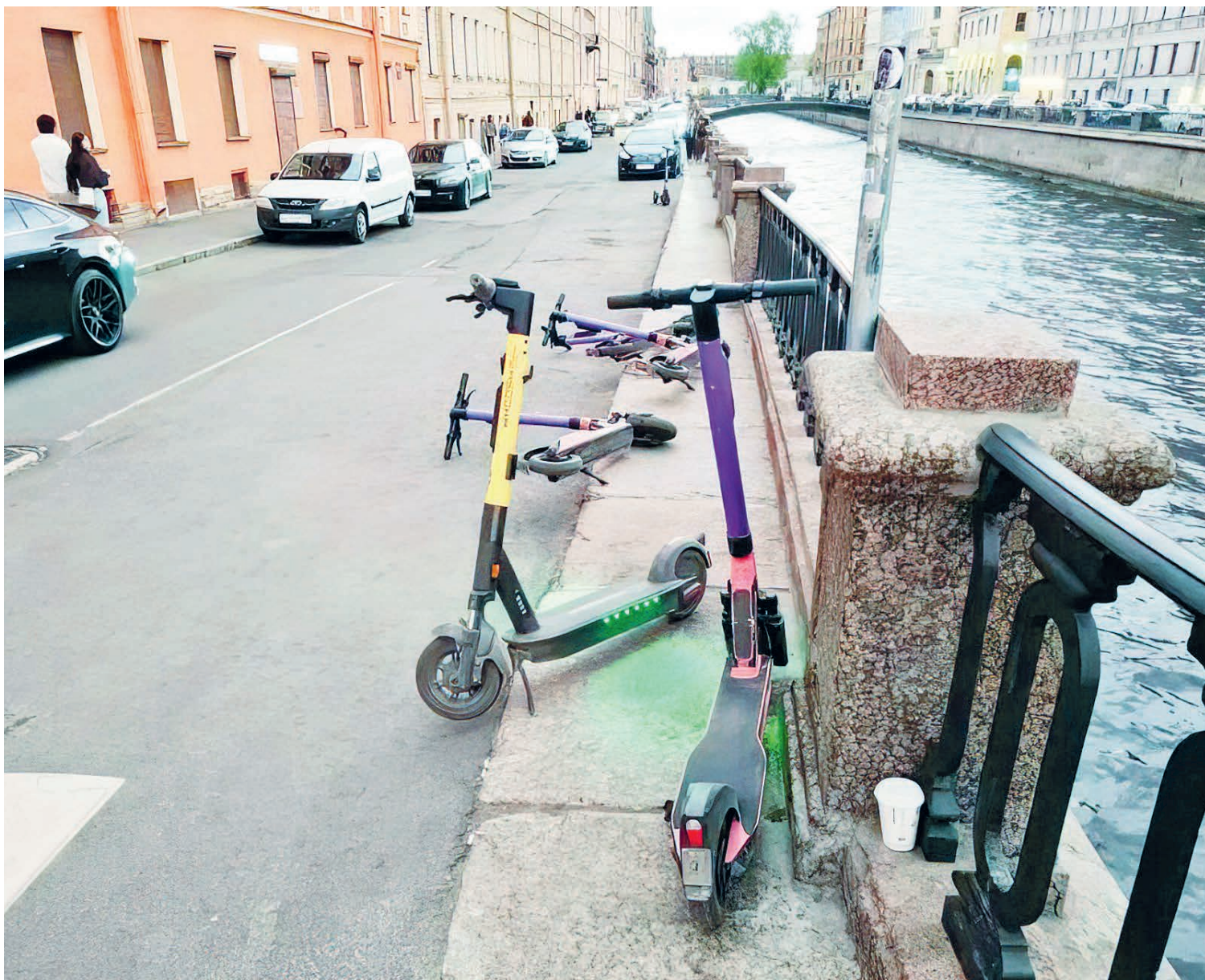
ФОТО ИЗОБРАЖЕНИЙ ИСТОЧНИКОВ

Вместо эпитафии парню, влетевшему на самокате под трамвай