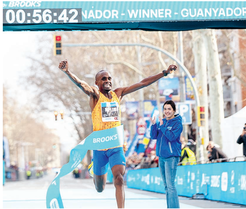
Угандец Джейкоб Киплимо рушит привычные представления о возможностях человека.

Между тем Киплимо – бегун универсальный, имеет близкие к мировым рекордам результаты на 3000, 5000 и 10 000 метров. И до последнего момента руководство сборной еще не определилось, на какие дистанции его заявить в Токио. Могут даже в марафоне.