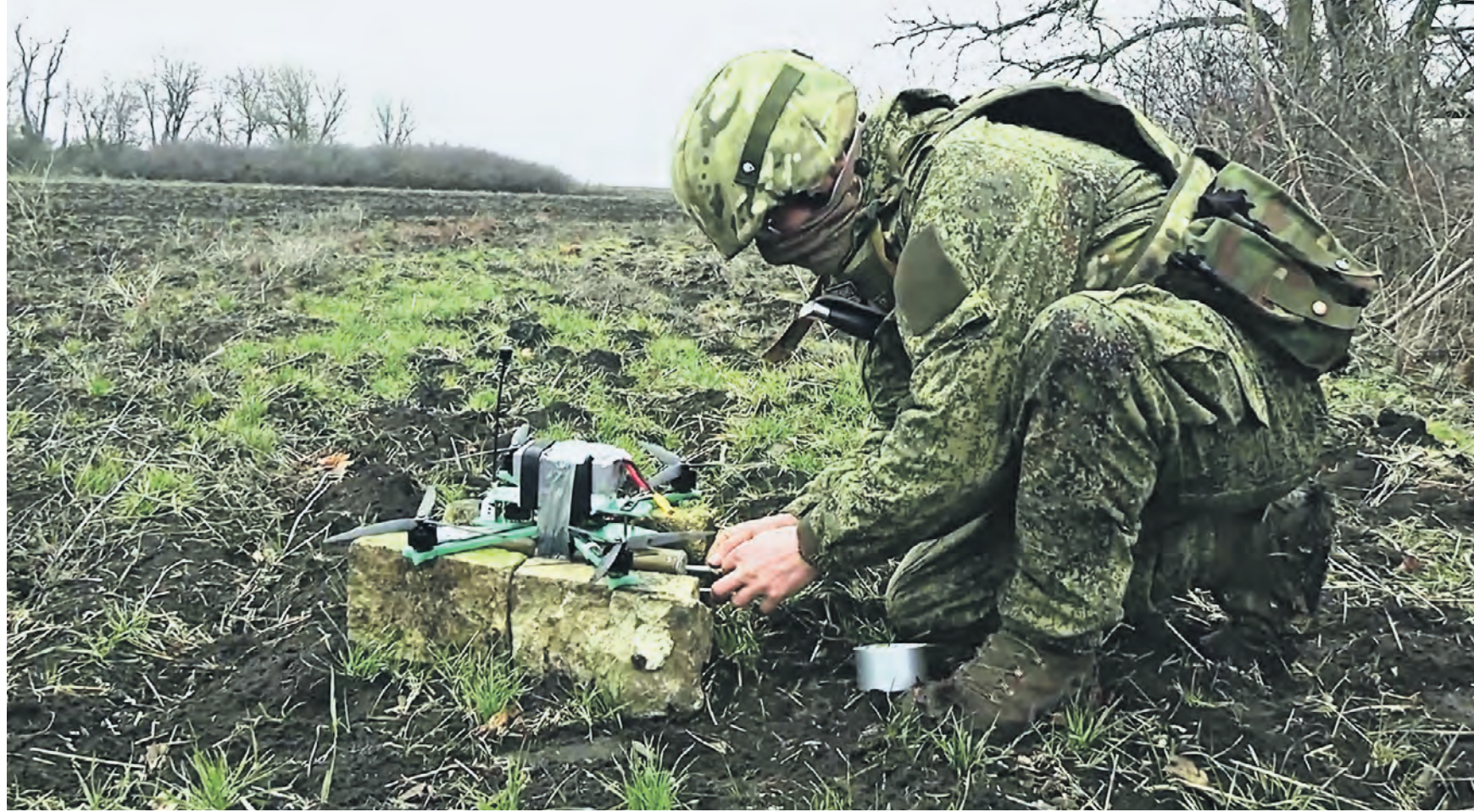
10 марта. Оператор беспилотных летательных аппаратов из российской группировки войск «Восток» с позывным «Парус» на передовой производит запуск дрона-камикадзе.