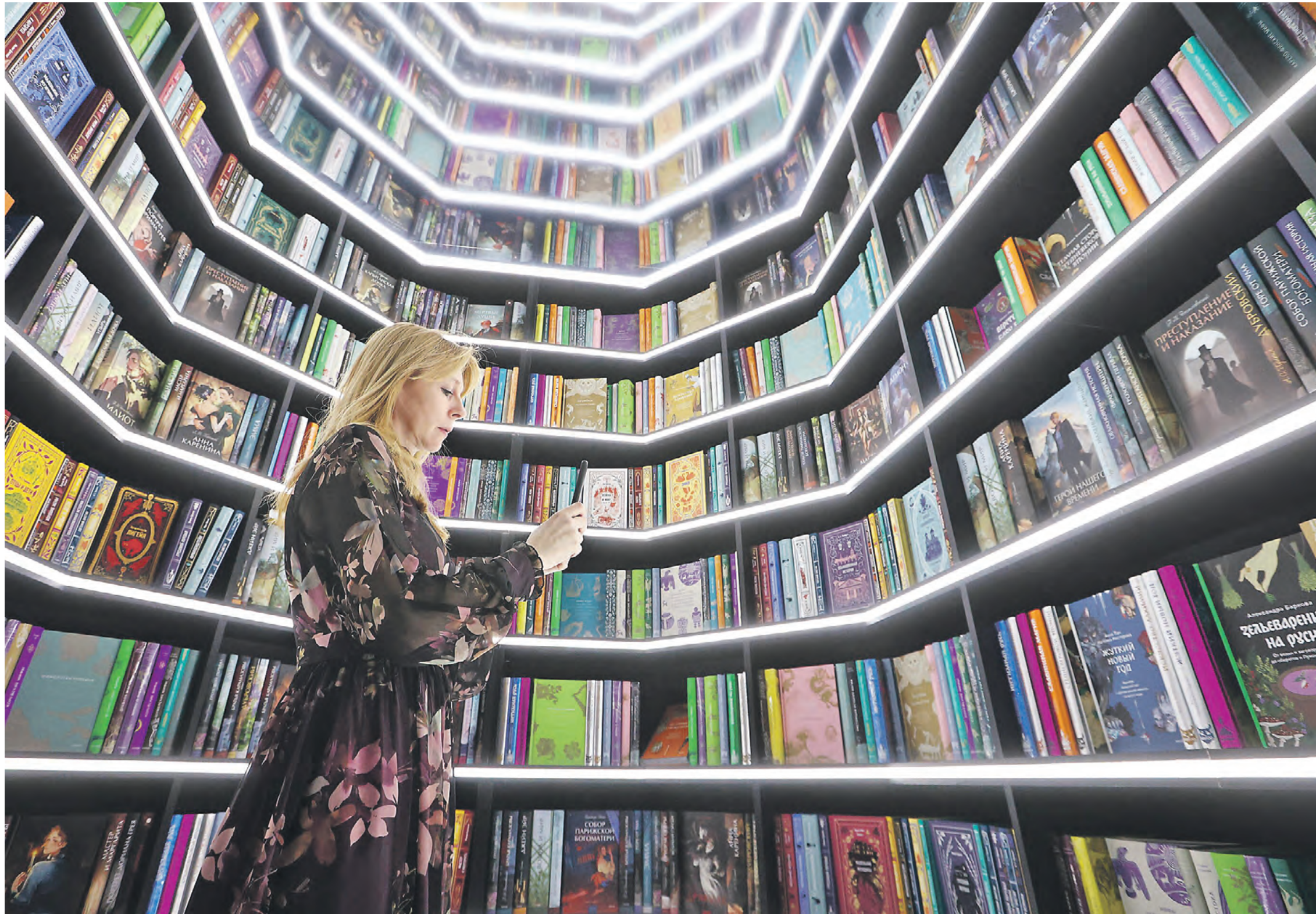
5 декабря 2024 года. Открытие ярмарки интеллектуальной литературы Non/fiction. Сейчас издательства предлагают книги на любой вкус, а выступающие эксперты индустрии помогают читателям выбрать лучшее

Растет популярность литературных курсов. Что это значит