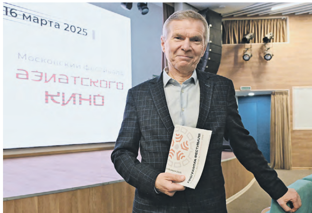
12 марта. Президент Московского фестиваля азиатского кино Валерий Шанин готовится к показу первых фильмов в рамках Дня китайского кино.