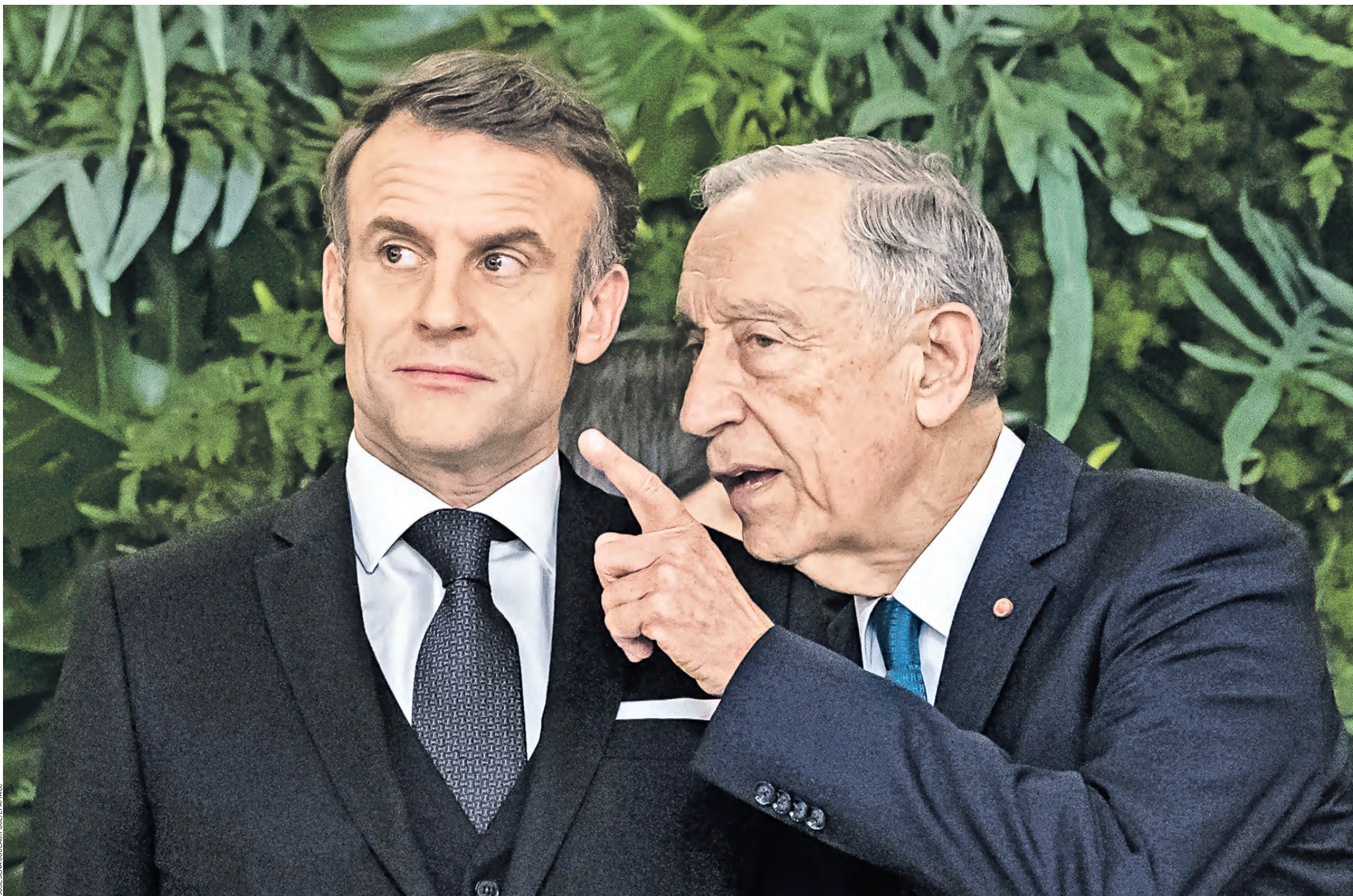
27 февраля. Президент Португалии Марселу Ребелу де Суза (справа) и президент Франции Эммануэль Макрон (слева) во время официального ужина в Лиссабоне

Либеральные элиты ЕС хотят «снести» консервативного Трампа