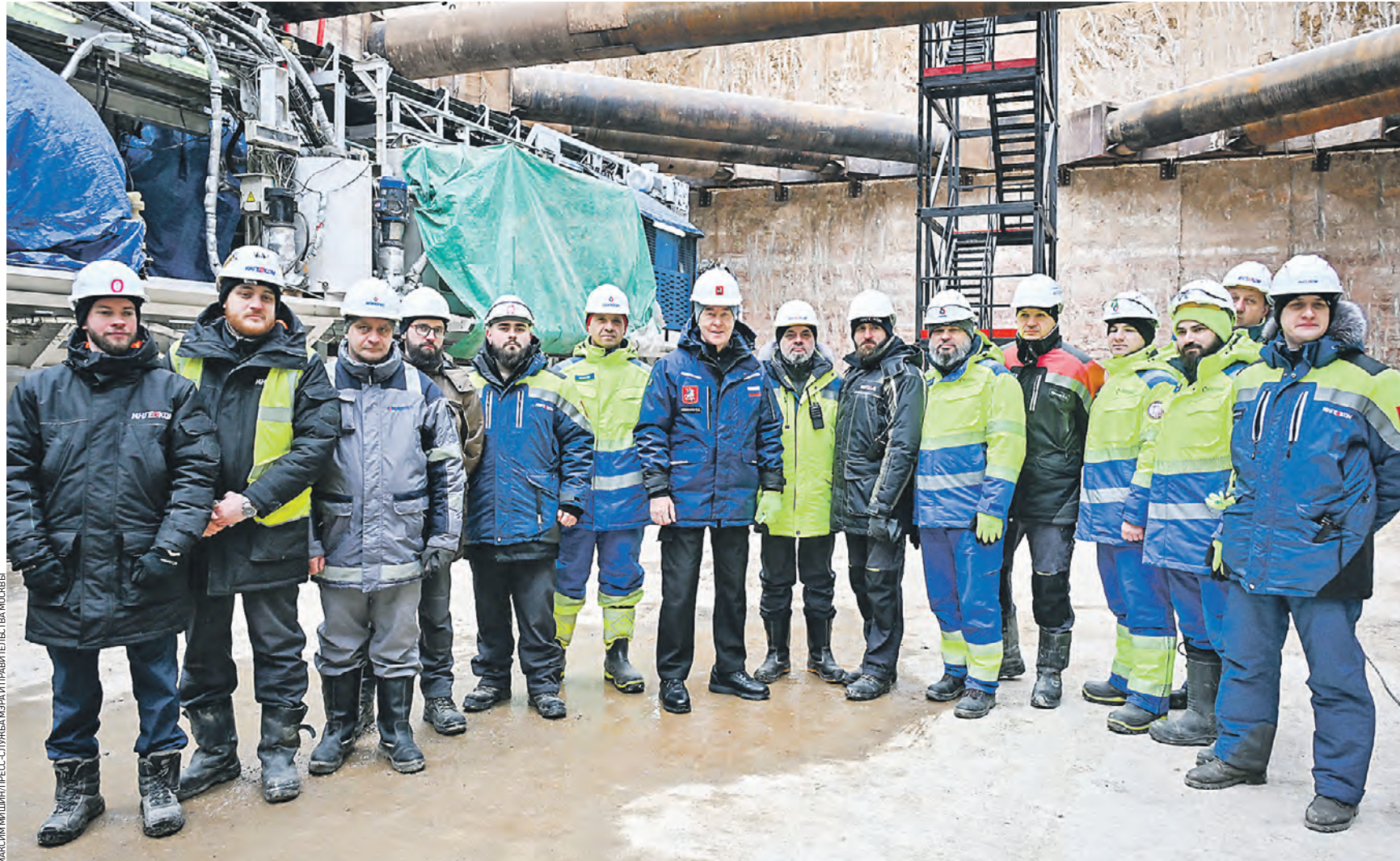
17 февраля. Мэр Москвы Сергей Собянин (в центре) дал старт проходке левого перегонного тоннеля на участке от будущей станции «Рублево-Архангельское» до «Липовой Роши» Рублево-Архангельской линии столичного метрополитена. Сегодня активное строительство ведется на многих участках новой ветки

Принята архитектурная концепция станции «Бульвар Генерала Карбышева» новой Рублево-Архангельской линии метро. Эта станция названа в честь ученого-инженера, генерал-лейтенанта инженерных войск, доктора военных наук, Героя Советского Союза Дмитрия Карбышева.