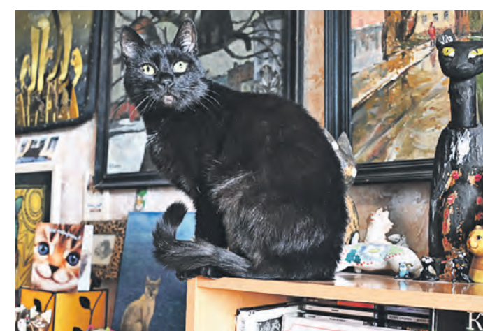
1 марта. Музейный кот по кличке Люттик посреди своих владений.

А портит здесь действительно есть что: все поверхности небольшого музея усыяны фигурками, книгами, картинками, магнитами и плюшевыми игрушками с изображением кошек.